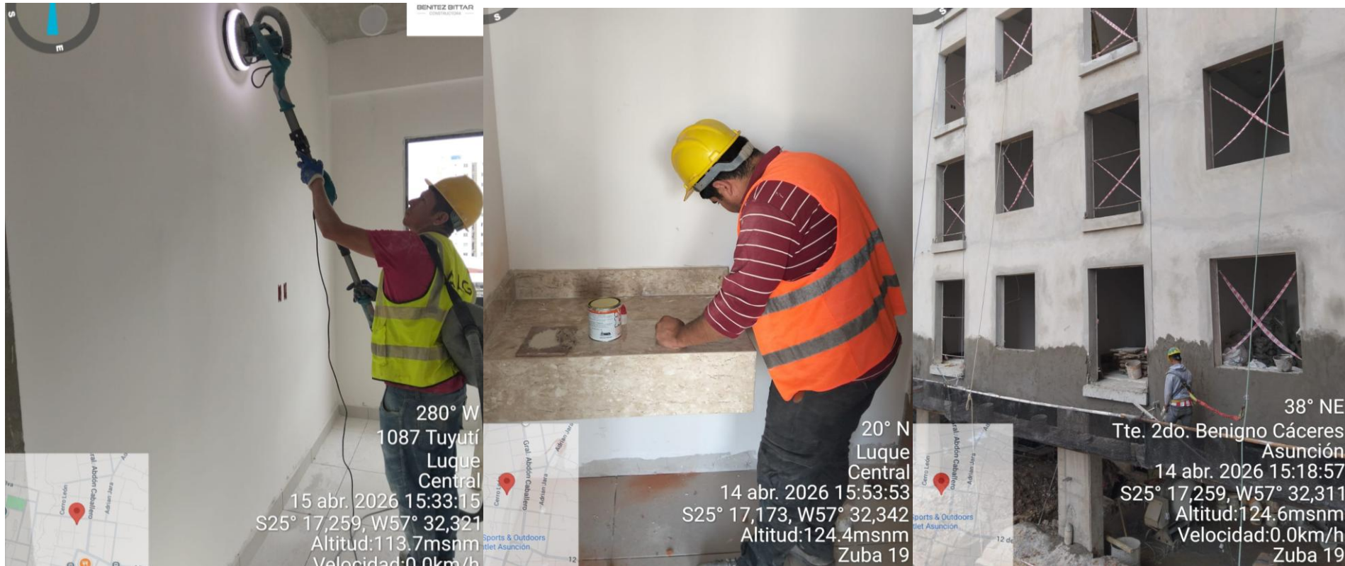
Lijado y sellado de paredes – Colocación de mesadas en baños – Revoque en fachada